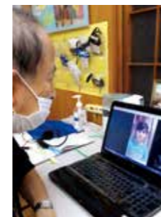
(早く友達に会いたいなあ)