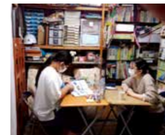
(感染対策をして対面で、受験勉強です)