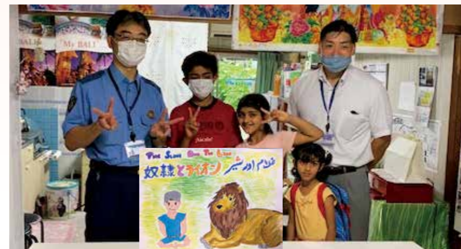
(収録に協力してくださった江南警察署のお巡りさんとパキスタンの子どもたち)

みんなの力が集まれば、どんな時だって、笑顔になれるよ! “Let's do our best and not lose to the Corona Virus”