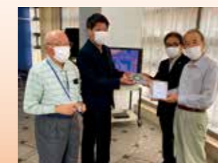
すいとぴあにDVDをお届け