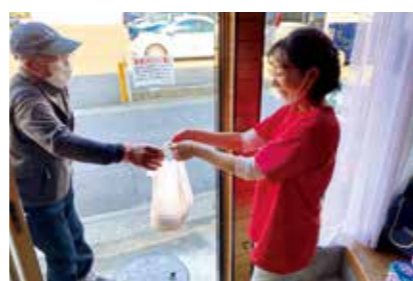
ご協力ありがとうございます！