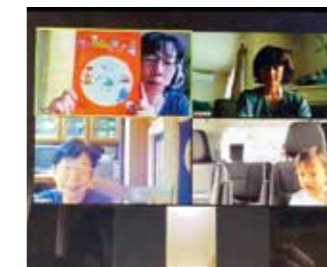
(Zoomで「絵本タイム」をやっています)