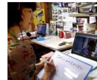
(家で日本語の勉強ができるので、随分、上達しました)