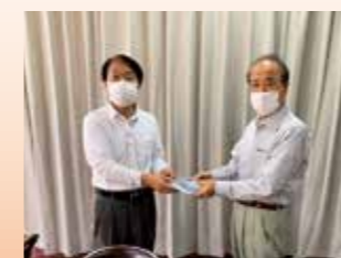
図書館にDVDをお届け