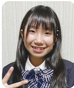
フイレ ニヤツ トウさん (ベトナム)